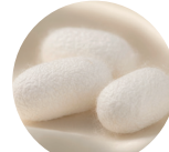
シルクエキス (加水分解フィブリン)