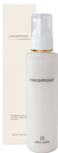
ココムール モイスト(スキンミルク) 150ml 5,000円(税込5,500円) 300g/パウチ 9,000円(税込9,900円)