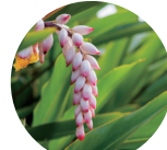
月桃 (ゲットウ葉水)