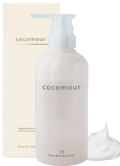
ココムール ウォッシュ(フェイス&ボディソープ) 400ml 5,000円(税込5,500円) 400g/パウチ 4,650円(税込5,115円)

いつまでもキレイでいたいママと、 デリケートな肌の子どもにぴったりな、 親子で一緒に使えるやさしいスキンケアです。