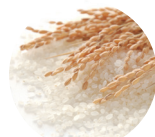
お米 (本来のヨーグルト(乳酸桿菌/コメ発酵液))