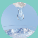
加水分解コラーゲン