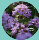
ワイルドタイムエキス