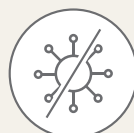
石油系界面活性剤