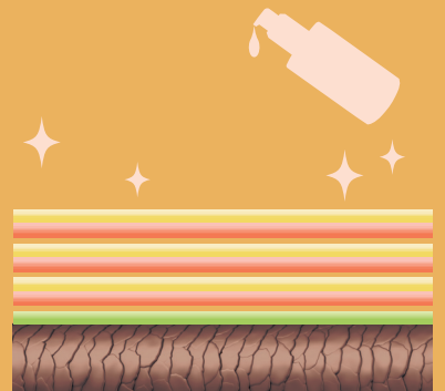
■ 裏技オイル ■ キトキト ■ ヘマヘマ

ガサつく髪や熱処理前に効果的な、なじみの良い天然オイル8種類を配合。しっとりツヤツヤな髪へ導きます。また、シアバターから取り出した皮脂に近い成分は、髪になじみやすく、優れた保湿効果と紫外線防御作用もあります。さらに、キトキトと一緒に三層重ねることで、本来のキューティクルに近い状態が再現でき、髪を保護します。