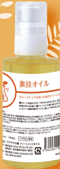
〈裏技オイル〉 150ml / 3,200円（税込 3,520円）