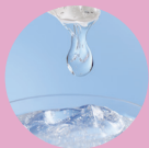
加水分解コラーゲン