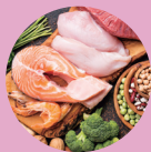
天然保湿因子+8種類のアミノ酸