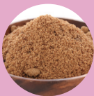
コメヌカスフィンゴ糖脂質