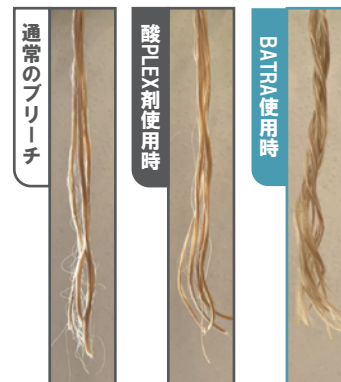
▶それぞれブリーチした髪にパーマをかけた毛束の写真。BATRAを使用した毛束(右)が一番カールがかかっていることが分かる。

ブリーチしたあとの髪の毛がパサついたり、チリついてしまったり、手触りに滑らかさが無くなってしまったことに少しでも悩みを感じている方は、ぜひBATRAをご使用ください！