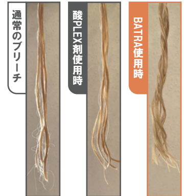
▶それぞれブリーチした髪にパーマをかけた毛束の写真。BATRAを使用した毛束(右)が一番カールがかかっていることが分かる。

ブリーチしたあとの髪 の 毛がバサついたり、チリついてしまったり、手触りに滑らかさが無くなってしまったことに少しでも悩みを感じている方は、ぜひBATRAをご使用ください！