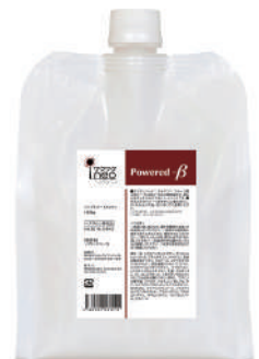
ワクワクneo 【パワードベータ】