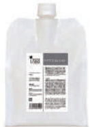
ワクワクneo 【ワクワクneoミスト】