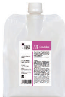
ワクワクneo 【ハイエマルジョン】