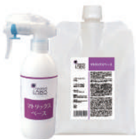
ワクワクneo 【マトリックスベース】