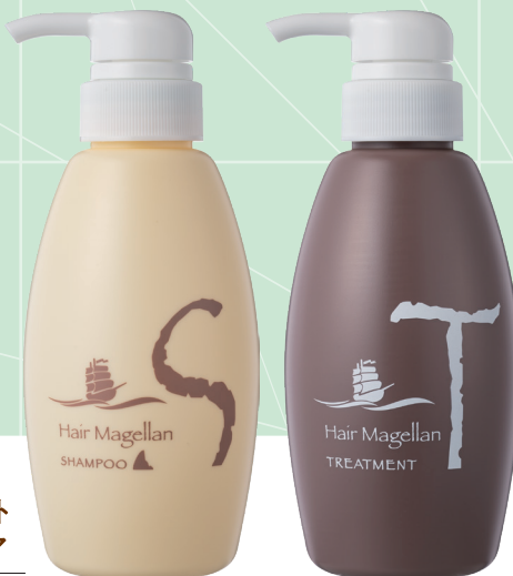
ヘアマゼラン シャンプー ヘアマゼラン トリートメント