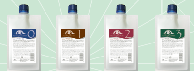
ヘアマゼラン ゼロ ヘアマゼラン ウン ヘアマゼラン ドイス ヘアマゼラン トレイス

• 500g / 5,400円(税込5,940円) • 500g×3本 / 14,580円(税込16,038円)