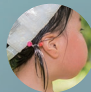
デリケートなこどもの肌

あなたのサロンで取り扱ってみませんか? 商品の取り扱いに関するお問い合わせ 営業部:0586-62-8035